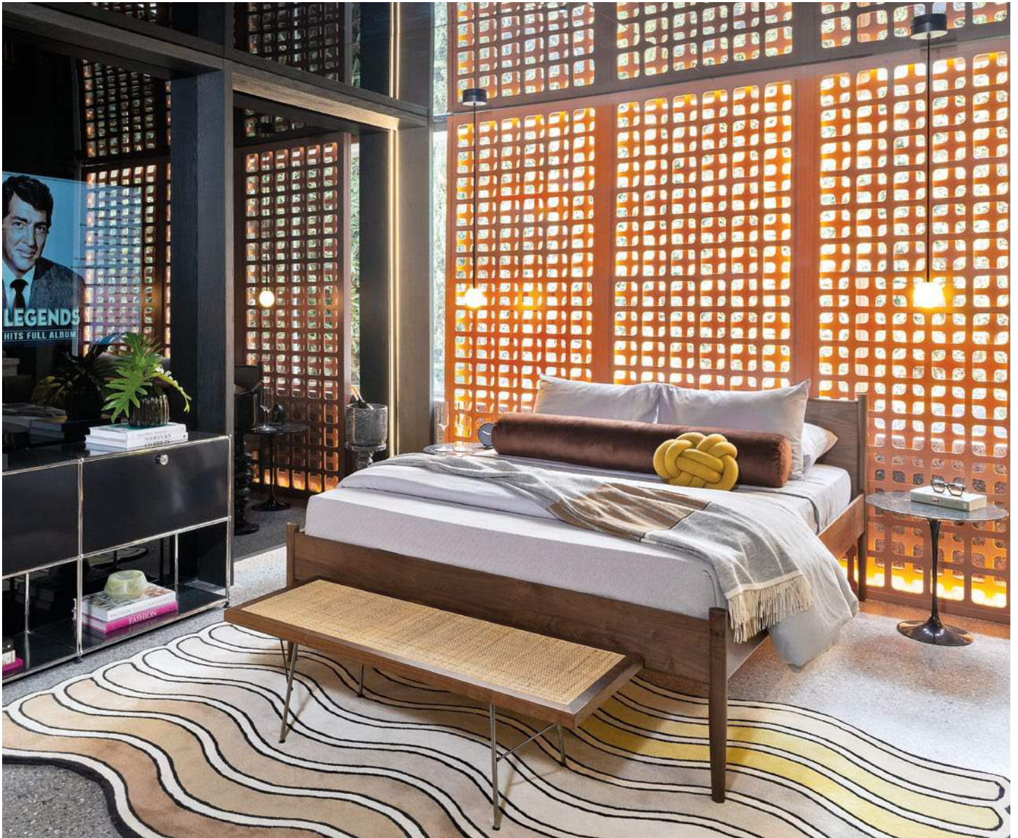
Página opuesta (en sentido horario) El vestíbulo fue diseñado por Comité de Proyectos. Umbral, por Cristina Grappin y Casa Quieta. El baño de la recámara-estudio de Studio Panebianco + Breuer. El espacio de herbáceas de Jardín Sustentable. Esta página La propuesta de Germán Velasco con Design Within Reach México.

lúdicas y narrativas. En este sentido, De la Cerda + Difane se enlazaron para redefinir, con Dasein , su proyecto inspirado en la arquitectura de los años 40 y 50, la concepción normativa de los espacios privados y de trabajo. Así pues, mediante la interacción equilibrada entre las formas curvadas y armónicas de la habitación con la arquitectura geométrica y lineal de la casa, dieron origen a un sitio multifuncional, personal y profesional que invita a la calma y a la introspección.